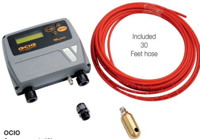
Included 30 Feet hose

Máxima altura medible: 13 ft. Longitud tubo sonda: 32 ft.